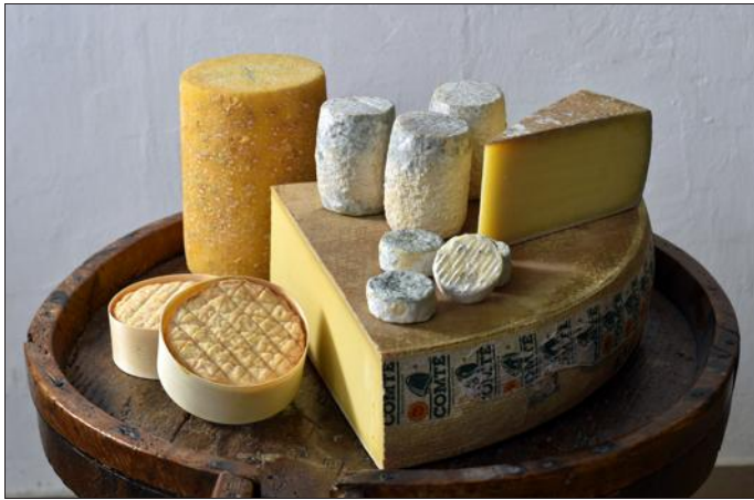
Le plateau de fromage de la Bourgogne-Franche-Comté pourrait bientôt compter un fromage du Morvan.

Le parc naturel régional du Morvan fêtera son 50 e anniversaire en 2020. C'est l'un des plus vieux parcs régionaux français. Pour valoriser l'agriculture et le territoire, le parc a lancé en 2018 la marque Porc plein air du Morvan. L'objectif aujourd'hui est de développer un fromage morvandiau.