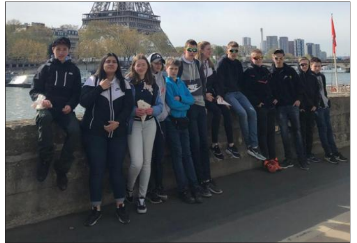
Les adolescents norvégiens sont arrivés jeudi à Paris.

Le projet scientifique d'éducation à l'environnement et au développement durable a déjà permis, cette année, à 35 élèves de 4 e de