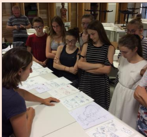
L'artiste est intervenue à plusieurs reprises auprès des collégiens.

« Sur ce projet, ce qui était assez plaisant, c'est que j'avais une grande marge de manœuvre. Les élèves avaient écrit un petit chemin de fer. Partant de là, on a déterminé une pagination avec les enseignants afin de voir quel espace j'avais pour raconter l'histoire et le volume d'informations scientifiques qu'il y avait à introduire. Quand j'ai eu tout ça entre les mains, j'ai pu broder comme je voulais pour faire quelque chose qui soit un peu amusant pour les jeunes lecteurs mais aussi pour moi à la réalisation. J'ai pris beaucoup de plaisir à dessiner un renard un peu rigolo. De plus, les enfants et les professeurs ont réagi très positivement à ce que je leur avais proposé. Ce qui est gratifiant. »